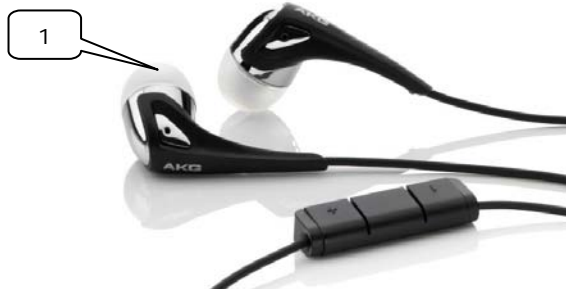
chrome, CRM, 3221H00140