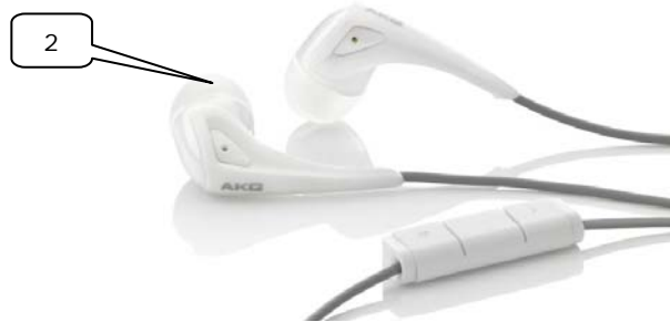
white, WHT, 3221H00150