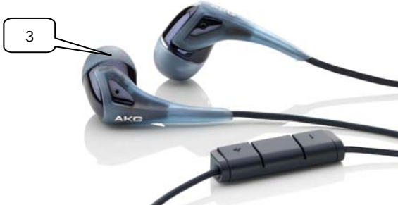
arctic blue, ABL, 3221H00160